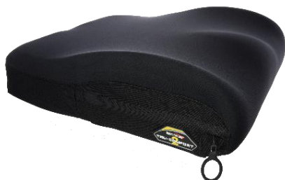
Housse Coolcore De série