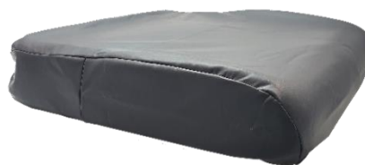
Housse incontinence Polyuréthane (sous la housse Coolcore) En option