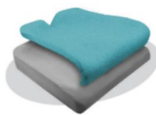
Coussin Zen SP