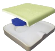
Coussin Solution SPP