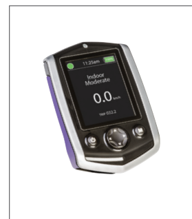
Contrôle d'environnement Infrarouge