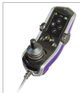
Manipulateur évolutif Q-Logic 3